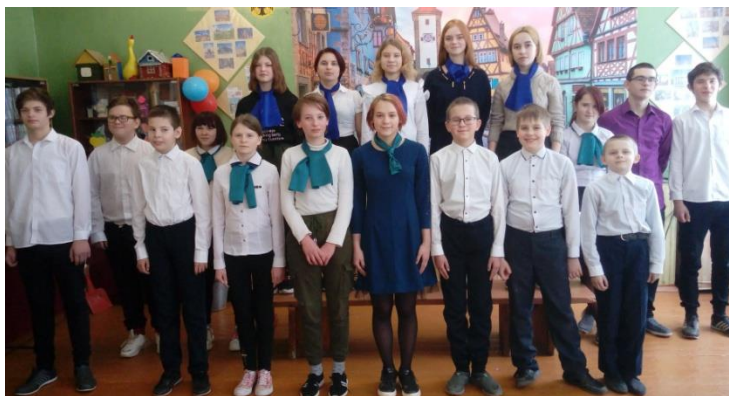
Хор МОУ Сукроменская СОШ

2021 год – юбилейный для конкурса. Смело можно сказать, что конкурс «прижился» на бежецкой земле, о нём знают в Тверской области, его ждут, к нему готовятся. Пусть он и дальше поддерживает и развивает интерес школьников к немецкому языку через изучение песенного творчества и музыкального наследия немецкоязычных стран.