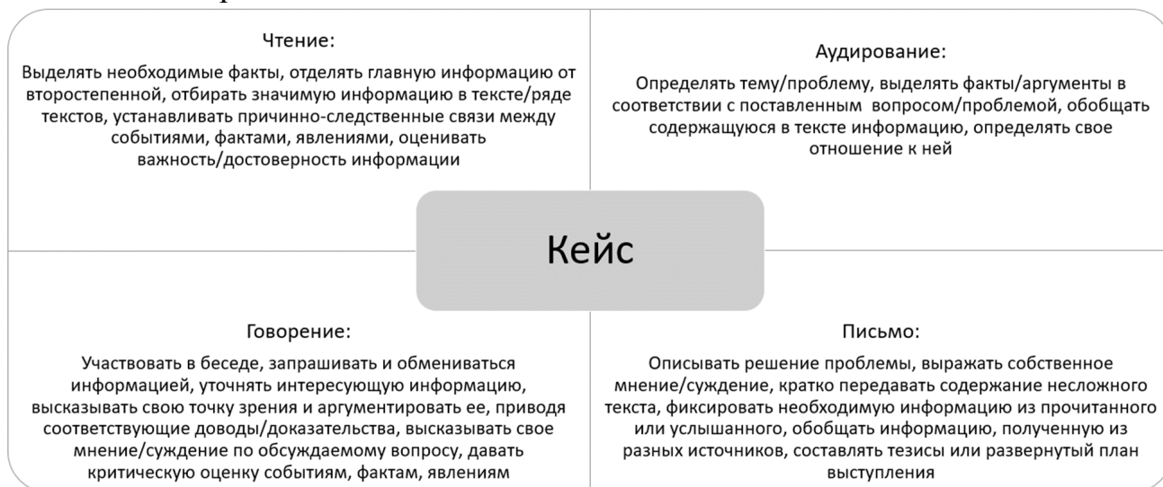
Схема 1 – Перечень коммуникативно-речевых умений, развиваемых на основе кейс-метода

Перечень коммуникативно-речевых умений, развиваемых на основе использования кейс-метода в рецептивных и продуктивных видах речевой деятельности представлен на схеме 1.