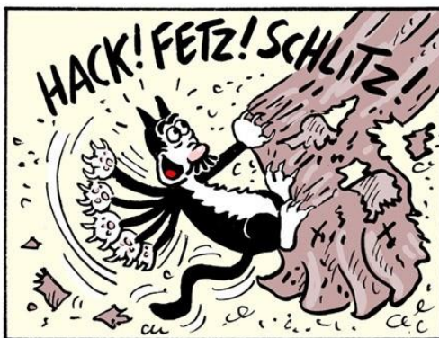
Рис. 2. Незвукоподражательные инфлективы.

Новые технологии с их речевыми инновациями не могли остаться без внимания художников слова. Таким «переходным мостиком» от реального Интернет-общения к художественному явились бестселлеры Д. Глаттауэра «Gut gegen Nordwind» («Лучшее средство от северного ветра») и «Alle sieben Wellen» («Все семь волн»), представляющие по своей форме эпистолярный жанр. От классического он отличается носителем текста (не бумага, а дисплей компьютера). Художественная имитация электронной переписки сохраняет её типические черты, оставаясь в классических рамках – концептуально устных, медиально письменных. Например (выделение подчёркиванием здесь и далее наше – В.П.):