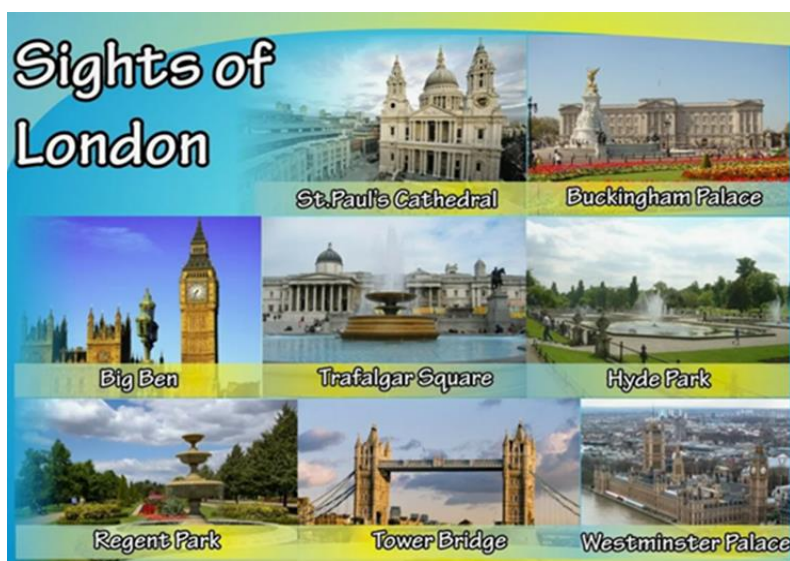
Рисунок 1. Коллаж по теме «Holidays Are Over»