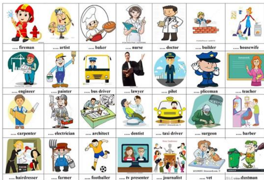
Рисунок 2. Коллаж по теме «After school»

Для определения темы и цели урока используется прием «Мозговой штурм». Школьникам дается информация о наиболее востребованных профессиях в Англии, чтобы они запомнили этот материал. В ходе урока обучающиеся должны подготовить и представить мини-рассказы на тему «Кем бы я работал в Англии» на основании коллажа (см. рис. 2). На данном уроке прием коллажирования используется на этапе усвоения нового материала.